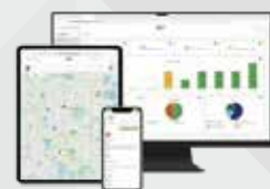
Digi Remote Managerで デバイスを管理