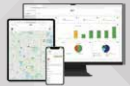
Digi Remote Managerで このデバイスを管理